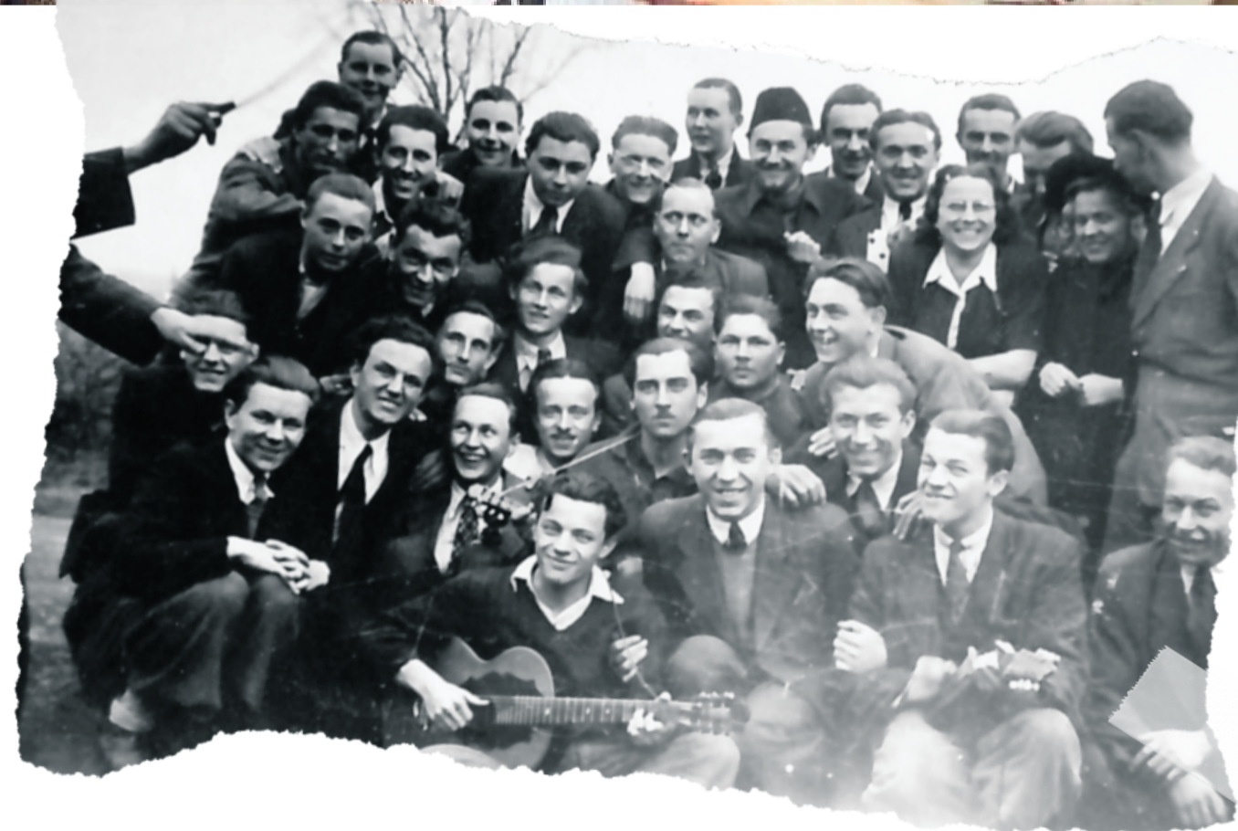
Zesendertig Hollandse en Tsjechische